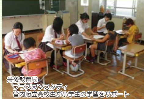
丹後教育局 プラスワンスタディ 管内府立高校生が小学生の学習をサポート

府内各地域の教育課題に対応するため、教育局では、企業や大学、関係機関と連携し、ふるさとの人材、自然、伝統や文化などの地域の特色を活かした取組を展開します。