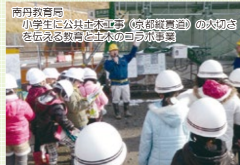
南丹教育局 小学生に公共土木工事(京都縦貫道)の大切さを伝える教育と土木のコラボ事業