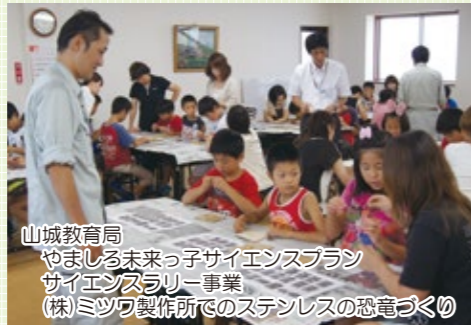
山城教育局 やましろ未来っ子サイエンスプラン サイエンスラリー事業 (株)ミツフ製作所でのステンレスの恐竜づくり