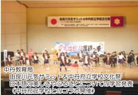
中丹教育局 由良川元気サミット&中丹府立学校文化祭 日本語の美しさやふるさとについての学習発表 (中丹府立学校とのコラボ開催)