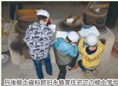
丹後郷土資料館旧永島家住宅での郷土学習