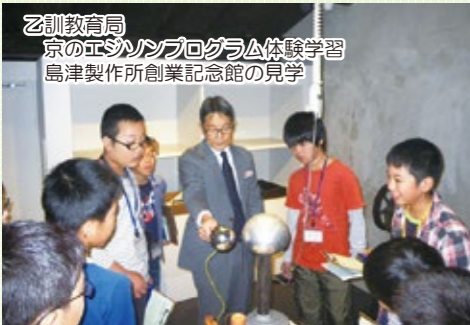
乙訓教育局 京のエシソンプログラム体験学習 島津製作所創業記念館の見学